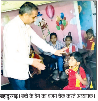
बहादुरगढ़। बच्चे के बैग का वजन चेक करते अध्यापक।

बीईओ ने स्कूलों की जांच के लिए 18 टीमें गठित की निजी स्कूल इसकी अनुपालना अवश्य करें