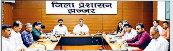
झज्जर। मुख्यमंत्री राहत कोष के आवेदनों पर चर्चा करते हुए अधिकारी।