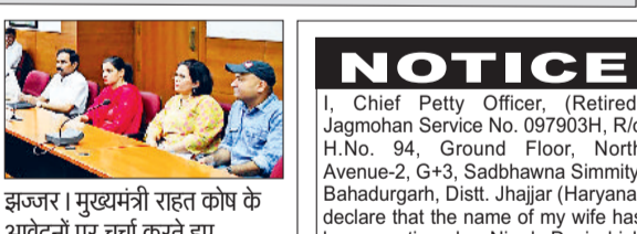
झज्जर। मुख्यमंत्री राहत कोष के आवेदनों पर चर्चा करते हुए अधिकारी।