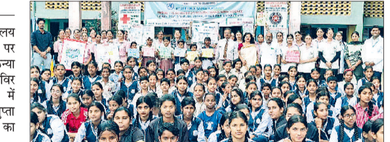
छात्राओं, स्टाफ व ग्रामीणों के वजन, रक्तचाप, हीमोग्लोबिन जांच, नेत्र परीक्षण तथा सामान्य स्वास्थ्य जांच की गई।