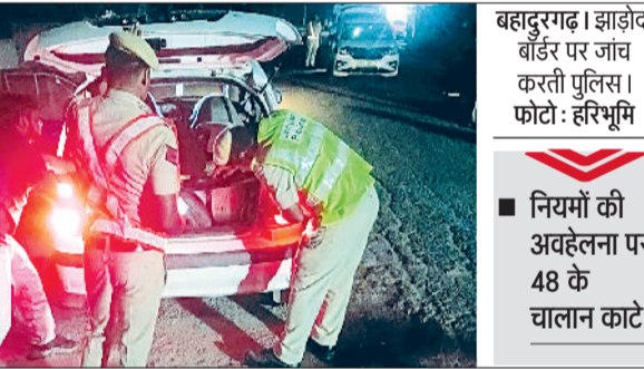
हरिभूमि न्यूज ॥ बहादुरगढ़

पुलिस की ओर झाड़ोदा बॉर्डर पर देर रात विशेष नाकाबंदी अभियान चलाया गया। यह अभियान रात 11 बजे से मंगलवार सुबह चार बजे तक चला। कुल 30 पुलिसकर्मी तैनात रहे। नाकाबंदी के दौरान 398 वाहनों की गहन जांच की गई। यातायात नियमों का उल्लंघन करने पर 48 चालान किए गए, जिनमें 5 ड्रिंक एंड ड्राइव के मामले शामिल हैं, जबकि एक वाहन को इंपाउंड किया गया। अभियान का उद्देश्य अवैध हथियार, नशीले पदार्थों की तस्करी और चोरी के वाहनों पर अंकुश लगाना रहा। पुलिस ने स्पष्ट किया कि ऐसे अभियान आगे भी जारी रहेंगे और लोगों से संदिग्ध गतिविधियों की सूचना देने की अपील की गई है, ताकि क्षेत्र में कानून व्यवस्था मजबूत बनी रहे।