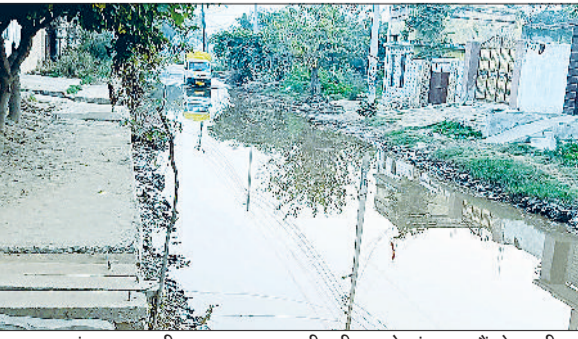
बहादुरगढ़। गांव खरहर की सड़क पर भरा पानी, सीएम को इससे ग्रामीणों को लगातार परेशानी झेलनी पड़ रही है।