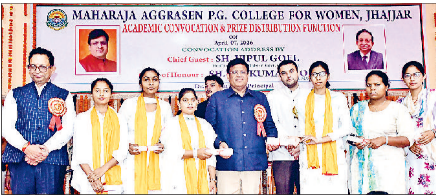
झज्जर। कार्यक्रम के दौरान छात्राओं को डिग्री देते कैबिनेट मंत्री विपुल गोयल।

महाराजा अग्रसेन महिला महाविद्यालय में दीक्षांत एवं वार्षिक पुरस्कार वितरण समारोह का आयोजन किया गया। इसमें राजस्व एवं आपदा प्रबंधन, शहरी स्थानीय निकाय मंत्री विपुल गोयल ने बतौर