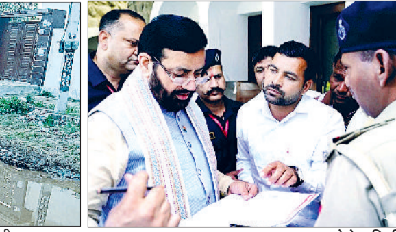
झज्जर। मुख्यमंत्री राहत कोष के आवेदनों पर चर्चा करते हुए अधिकारी।

उन्होंने मुख्यमंत्री से संबंधित ठेकेदार के खिलाफ उचित कार्रवाई करते हुए जल्द से जल्द कार्य शुरू करवाने की मांग की।